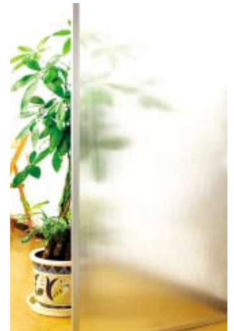
ペアカーボ クリアフロスト 施工イメージ