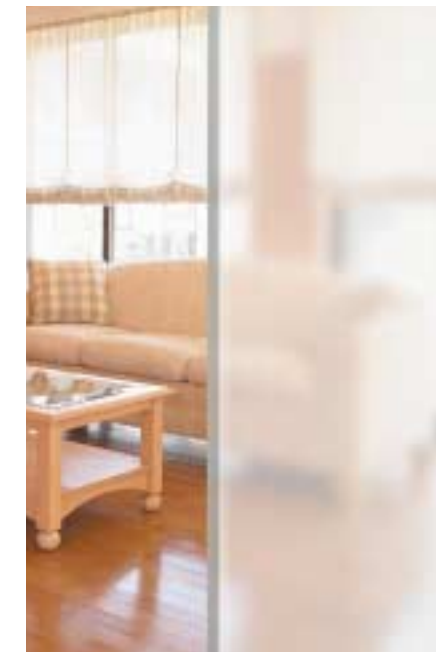
ペアカーボ クリアフロスト 施工例