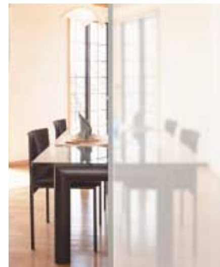
ペアカーボ クリア 施工例