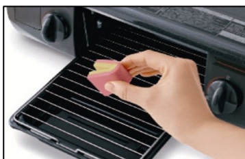
魚焼きグリルの網に！