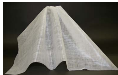
(ミライフを使用したブラインド)