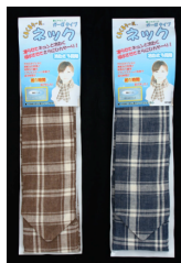
商品形態と着用例