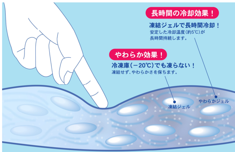
保冷具構造図:不凍ジェルと凍結ジェルの「柔軟2重構造」