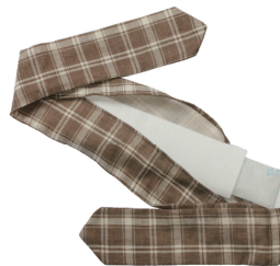
外カバー、内カバー、保冷具のセット