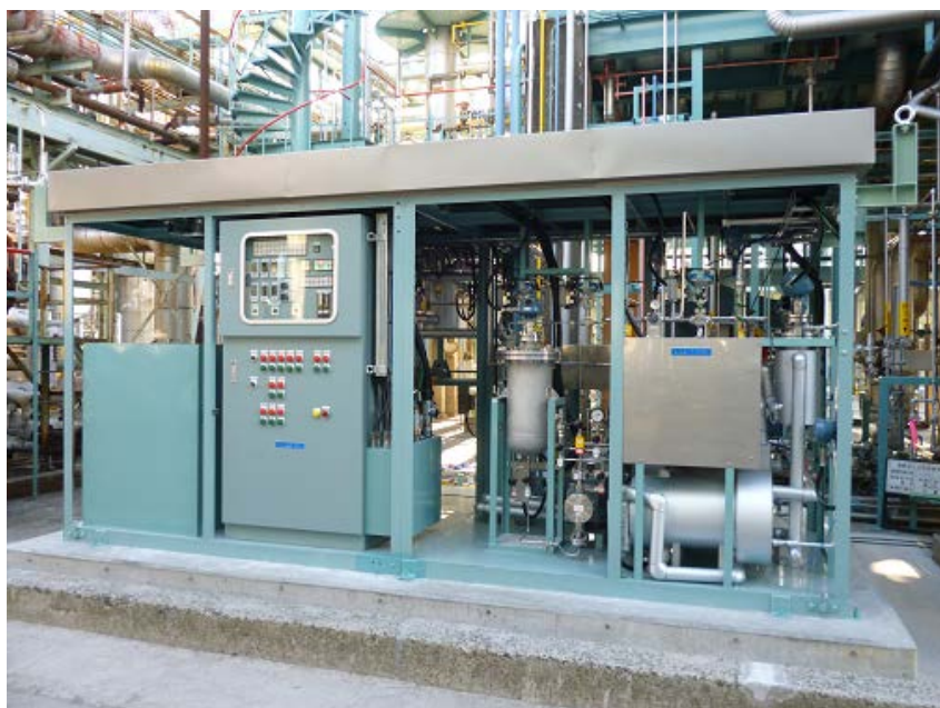
図1. JX日鉱日石エネルギー(株)川崎製造所に設置した実環境下試験装置

※「グリーンサステイナブルケミカルプロセス基盤技術開発／規則性ナノ多孔体精密分離膜部材基盤技術の開発」 (詳細は用語解説※1参照)