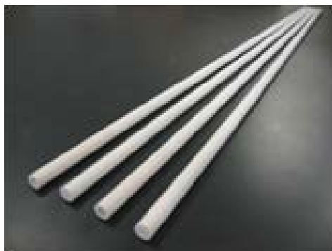
図 3. 長尺膜エレメント(1m)