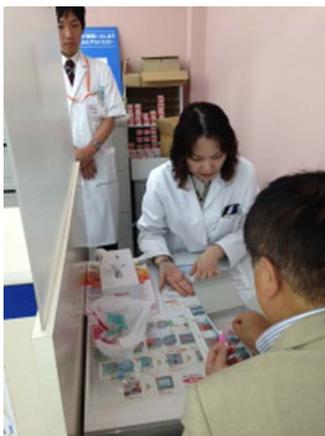
ドラッグストア店頭での自己採血