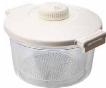
（クリアご飯・蒸し器）

「パパッとクック」は、株式会社マーナが展開している電子レンジで簡単、手軽でヘルシーに調理できる調理器具で、全国の専門店、量販店及び web での販売がスタートしています。今回、「TPX ® 」の最大の特徴である、ポリオレフィン素材として世界最高の耐熱性を有し、剥離性に優れ、環境に優しい点が評価され全面採用となりました。