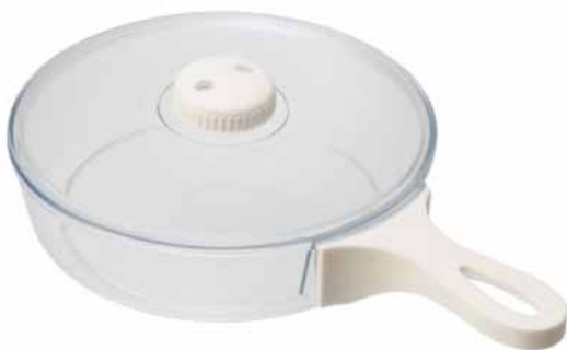
（クリア浅型調理器）

三井化学株式会社の世界オンリーワン製品の一つである「TPX ® （ポリメチルペンテン樹脂）」が、このたび、株式会社マーナの電子レンジ調理器「PaPa!tto COOK（パパッとクック）」シリーズの素材として全面採用されました。