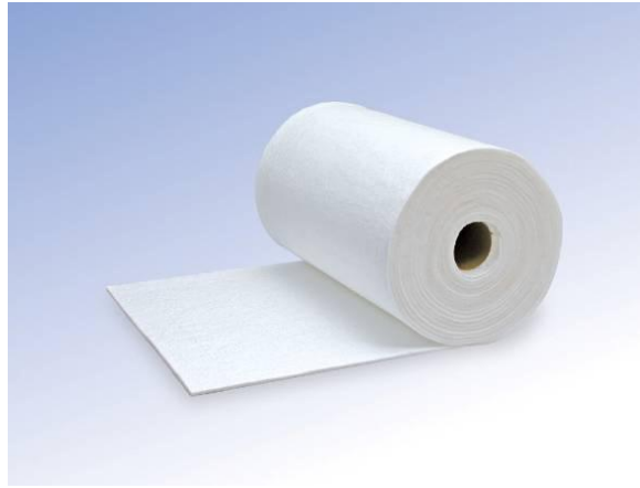
マフテック アルミナ繊維「MAFTEC®」