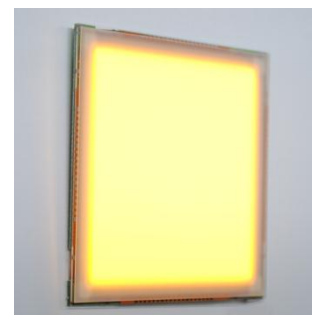
【ブルーライトレスモジュール】