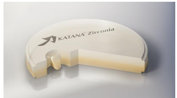
【独自の4層構造】 (イメージ図)