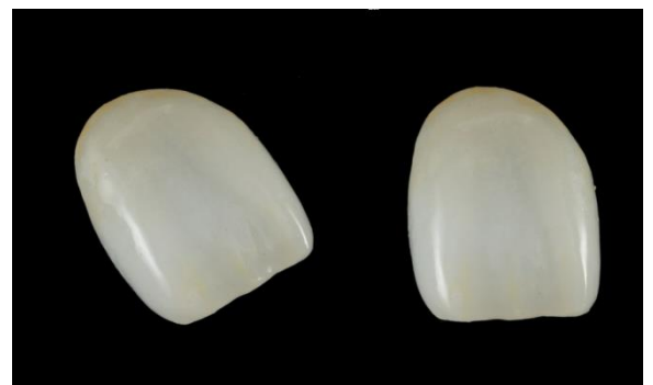
新製品「UTML」で製作されたフルジルコニア修復物 ※ステン併用