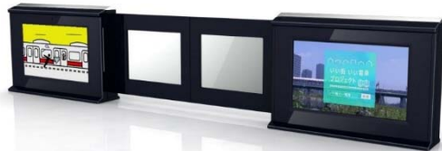
マルチメディアホームドアイメージ

本ホームドアは、AGC旭硝子が開発したガラス一体型デジタルサイネージ「inforverre ® （インフォバー）」を、三菱電機および日本信号が制作するホームドアの戸袋部分に設置し、東急電鉄がコンテンツ配信の仕組みと運用モデルを構築します。今回の実証実験では、鉄道業界では最大となる55インチサイズのデジタルサイネージを組み込んだ本ホームドアを東横線武蔵小杉駅、大井町線溝の口駅の一部に設置し、屋外環境での技術的課題を検証すると共に、デジタルデバイスを組み合わせたホーム上での新たな情報発信に積極的に取り組んでいきます。