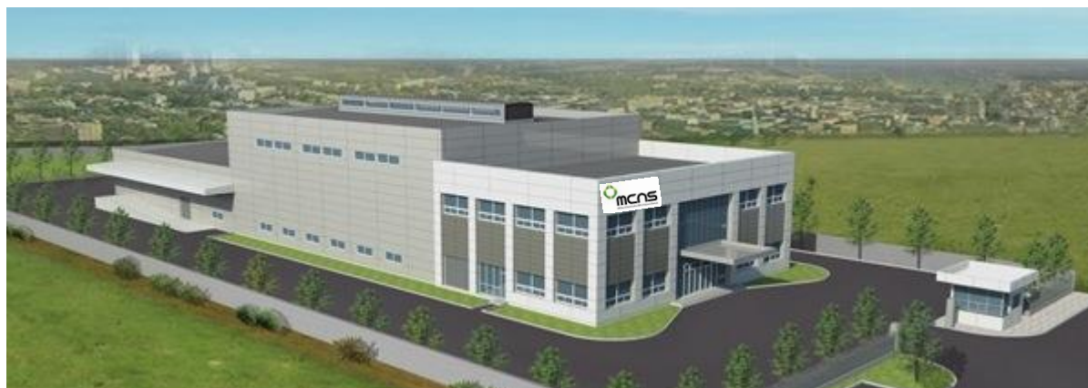
工場の完成予想図

※システムハウスとは：ポリオールを含む、ポリウレタンフォーム用原料をお客様ごとに処方の調整を行ったうえで供給するとともに、きめ細やかなサービスを行う製造・販売拠点のことです。