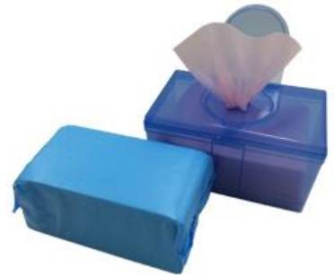
取り出しやすい<ベンドハンディ>POP UPタイプ

ドライ、ウェット両方での使用が可能で、アルコールを浸み込ませて使用する際は、保管用のディスペンサー(別売)もご用意しております。