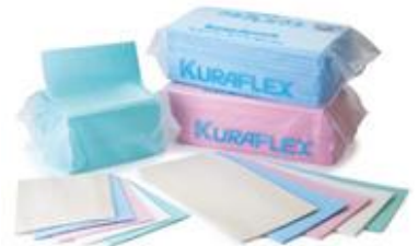
使いやすく衛生的な<モノデュア>

高圧水流で繊維同士を強く絡ませたことで、耐久性を実現。長時間使用しても、毛羽立ちにくく衛生的です。