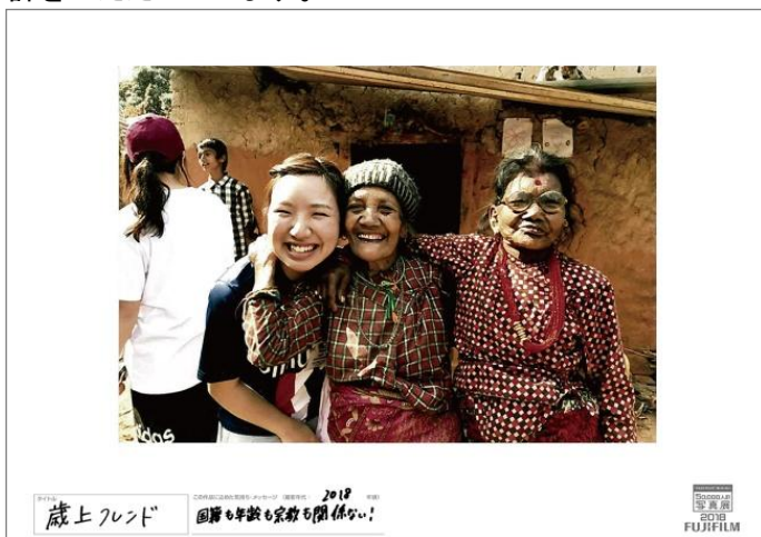
タイトル 歳上フレンド

さらに、今年も昨年に引き続き、本写真展の趣旨に賛同いただいた複数企業・団体との共同企画展を併催します。ご両親からお子さまへの愛情が伝わる写真やペットの愛らしい姿、食卓を囲む家族の笑顔など、素晴らしい写真がたくさん寄せられています。毎年この共同企画を通して初めて写真展に参加される方も多く、「写真を会場で見ると、スマホの画面とは違う大サイズプリントの迫力を感じられる」「一緒に会場に行く家族の笑顔や感想が楽しみ」など大変好評をいただいています。