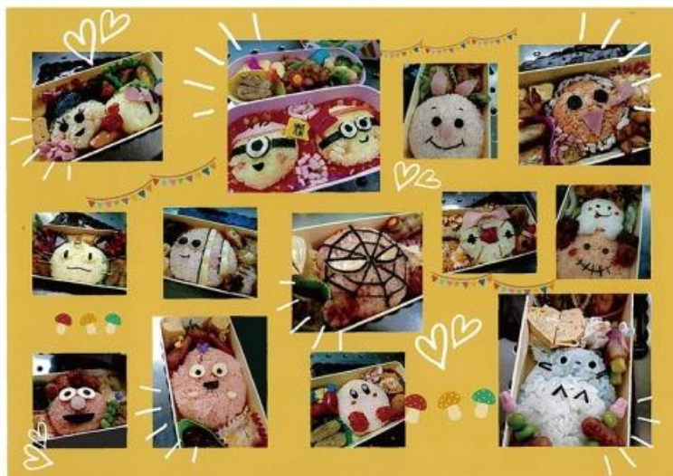
タイトル 1♡キャラ弁 娘の小学6年間のお弁当です。