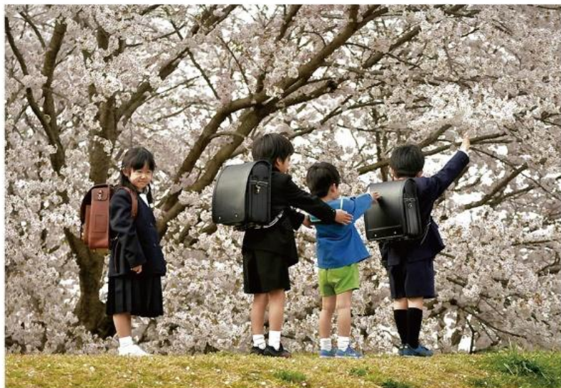
タイトル 男の子 女の子 新生活がんばれー!!!