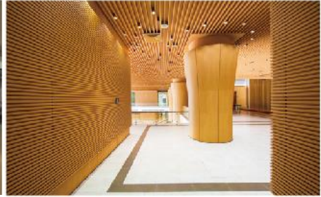
The National Assembly Office of Vietnam