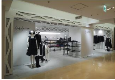
ヨウジヤマモト松屋銀座店