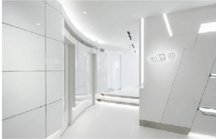
オーラルデザイナー新宿デンタルクリニック

「ALPOLIC/ for INNER LIGHT™」は、各種塗装、柄などのカラーバリエーションも100色以上をラインナップし、新築だけでなくリフォームにも適しています。当社は、国内外において、商業施設、オフィスビルから一般住宅まで幅広い分野での採用を働きかけていきます。