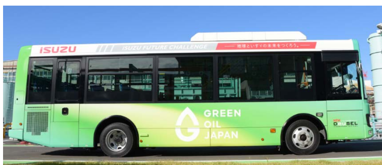
イすゞ自動車の『GREEN OIL JAPAN』宣言ラッピングバス

次世代バイオディーゼル燃料は、2014年6月より当社とイすゞ自動車と共同で取り組んでいる「次世代バイオディーゼルの実用化に関する研究」の一環で、実証プラントと同様の原料および精製方法により製造した次世代バイオディーゼル燃料を用いた性能試験を実施し、エンジンに変更は加えずに含有率100% ※6 で使用することができることを確認しました ※7 。この結果を受けて、イすゞ自動車では2018年12月より、次世代バイオディーゼル燃料を含有した燃料を用いて、イすゞ自動車藤沢工場と湘南台駅間シャトルバスの定期運行による実証走行を開始します。