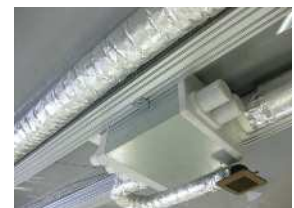
<ファイアーブレイク>施行例