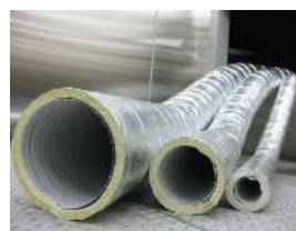
<ファイアーブレイク>

当社では、今後不燃性が厳しく要求される全館空調システム用のダクトとして、住宅メーカー、電機メーカー、空調システムメーカー、住宅施工会社などに展開していく方針です。