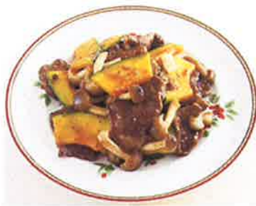
炒め物の下加熱に。