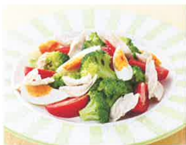
そのまま温野菜のサラダに。