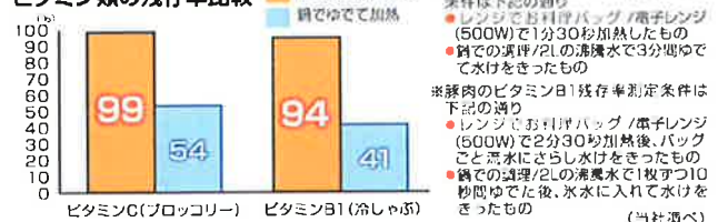
ビタミン類の残存率比較