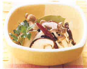
きのこなどを加熱して つけるだけでマリネに。