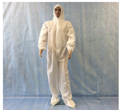
<エレブレイク>を使用した保護服