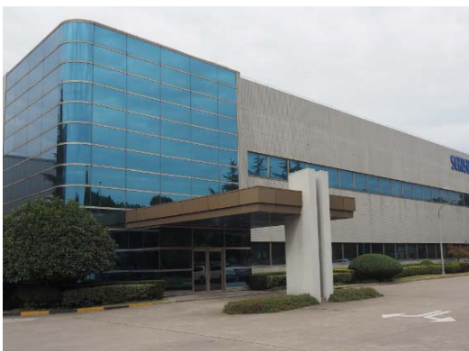
<センターのある積水ポリマテック上海>