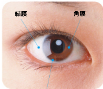
輪部:角膜と結膜の境界にあり、角膜上皮細胞の幹細胞が存在する。

角膜上皮は、眼の最表層に位置し、結膜と角膜の境界領域である輪部に存在する角膜上皮幹細胞が細胞源になっています。角膜上皮幹細胞が消失すると角膜上皮幹細胞疲弊症と呼ばれる状態となり、角膜が混濁し、視力低下の原因となります。角膜上皮幹細胞疲弊症の原因には、先天性のものとして無虹彩症や強膜化角膜、外因性のもとしてアルカリ腐食や熱傷、内因性のもとしてスティーブンス・ジョンソン症候群や眼類天疱瘡、そのほか特発性のものが挙げられます。