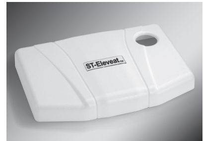
使用例 (自動車エンジンカバー)