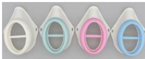
カラーバリエーションの例