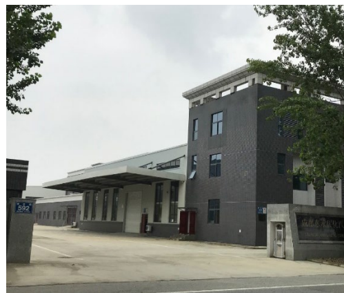
成都東承住化汽車複合塑料有限公司