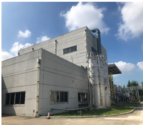
珠海住化複合塑料有限公司無錫分公司