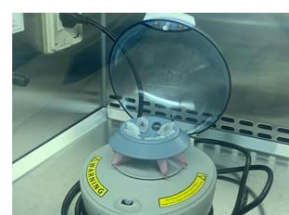
攪拌器を用いて繊維上から ウイルスを洗い出し