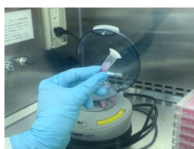
ウイルス液と対象布を接触 (1分間または10分間)