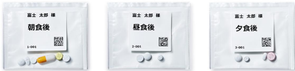
(例)一包化された薬剤

一方で、薬局・薬剤師には、患者の薬物治療の適正化に関わる情報の聴取・薬学的管理・記録、在宅医療における服薬支援・指導などが求められており、地域での薬局・薬剤師の役割期待が拡大しています。その役割を果たすためには、薬局における対物業務から対人業務への機能シフトが不可欠であり、業務の正確性と安全性を両立し、かつ業務の効率化を図ることが重要となります。その課題の解決手段のひとつとして、目視のみならず、システムを活用した一包化監査業務の効率化が着目されています。