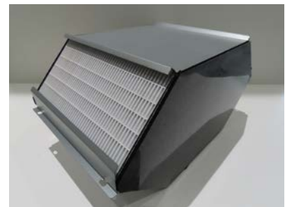
透湿膜全熱交換エレメント

共同開発した「透湿膜シート」を換気装置「全熱交換器ユニット」の主要部品である全熱交換エレメントに採用しました。このシートは従来の紙製シートの約 1/3 の薄さで、空気中の熱を効率良く移動させます。またこの透湿膜は水蒸気を選択的に透過させる一方で、菌やウイルス、二酸化炭素といった室内の空気を汚染する物質の遮断性を向上しています。さらに洗浄や消毒も可能なので、清潔性を維持することもできます。この「透湿膜シート」とダイキン独自の技術である「対向流型フレーム構造」を組み合わせることで、全熱交換エレメント内部の空気漏れを大幅に低減しました。