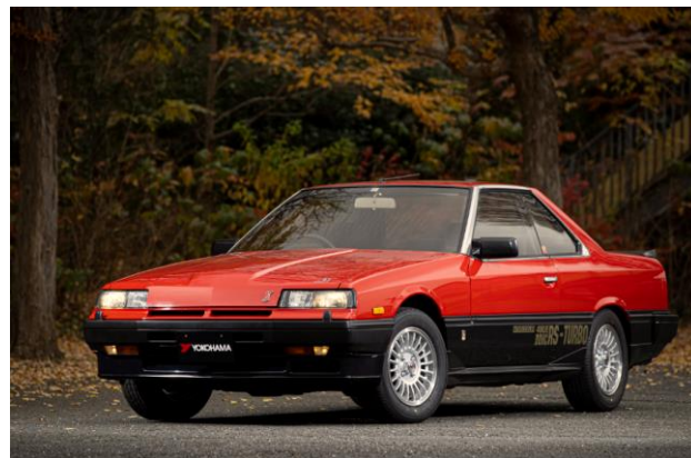
「ADVAN HF Type D」を装着した日産スカイライン(DR30 型)