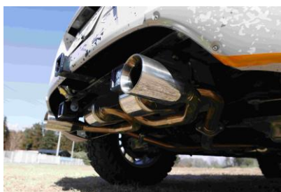
HKS SUPER SOUND MASTER