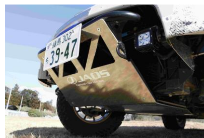
JAOS 特注アンダーガード IPF 2 インチドライビングランプ