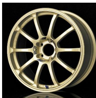
ADVAN Racing RCⅢ