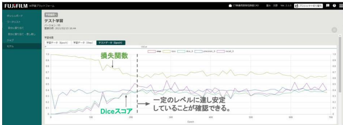
図 4 学習の進捗状況の可視化画面

AI 開発支援プラットフォームに組み込まれた学習モデルを直感的な操作で選択し学習を実行できます。グラフ(横軸が学習の回数、縦軸が性能指標)から、学習プロセスの進行状況を確認することができます。この図では学習の回数が増えるに従い、損失関数(開発した AI エンジンによる出力結果と正解データの差を評価する指標(黄緑))が下がっている一方で Dice スコア(開発した AI エンジンによる出力結果と正解データの一致度(緑))が上がっていて、一定のレベルに達し安定していることから、十分学習できていることが確認できます。