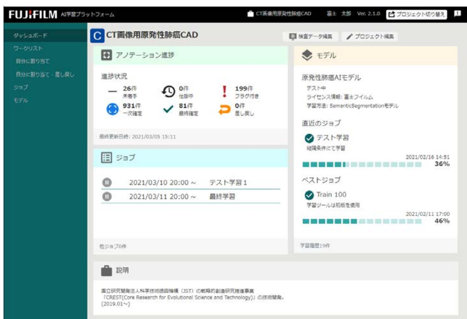
図 2 プロジェクト管理のダッシュボード画面

学習済みの AI エンジンを用いたテスト結果をプラットフォーム上で即座に表示・試行できます(図 5)。また、そのテスト結果を新規データのアノテーションに活用できます。特に臓器の認識や腫瘍などの関心領域の抽出を可能にするセグメンテーション機能の開発においては、新しい画像に対して、開発途中の学習済み AI エンジンを使って抽出した領域に編集を加えることで、効率的にアノテーションを進めることができます。随時再学習を行うことで、より効率的な AI エンジンの開発が期待できます。