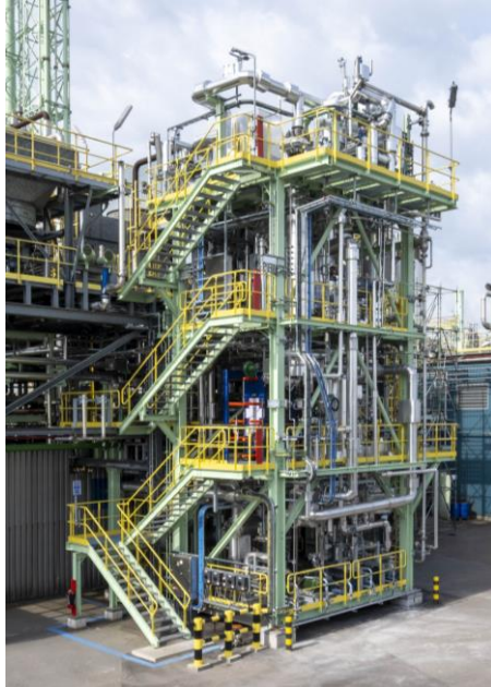
導入された Qpinch 設備 (所在: ベルギー、アントワープ)