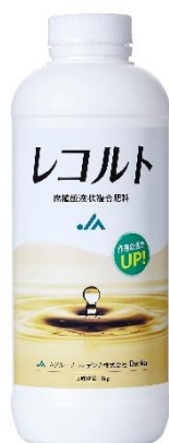
バイオスティミュラント「レコルト™」

デンカ株式会社（本社：東京都中央区、代表取締役社長：今井 俊夫）はバイオスティミュラント「レコルト™」を10月からJA全農グループを通じて全国へ展開いたします。腐植酸液状複合肥料として、独自製法の活性フルボ酸により作物の活性化効果を付与し、収量増に貢献いたします（*1）。