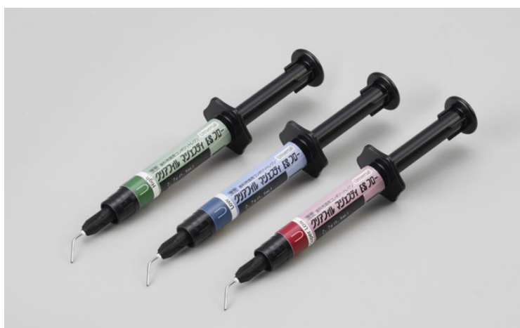
〈クリアフィル® マジェスティ® ES フロー〉 Universal

クラレノリタケデンタル株式会社(本社:東京都千代田区、社長:山口里志)は、保険適用の歯科充填用コンポジットレジン〈クリアフィル® マジェスティ® ES フロー〉のユニバーサルシェードに、新たに2種類の流動性バリエーション(“High”(高流動型)／“Super Low”(超低流動型))を追加し、2021年11月22日に新発売します。