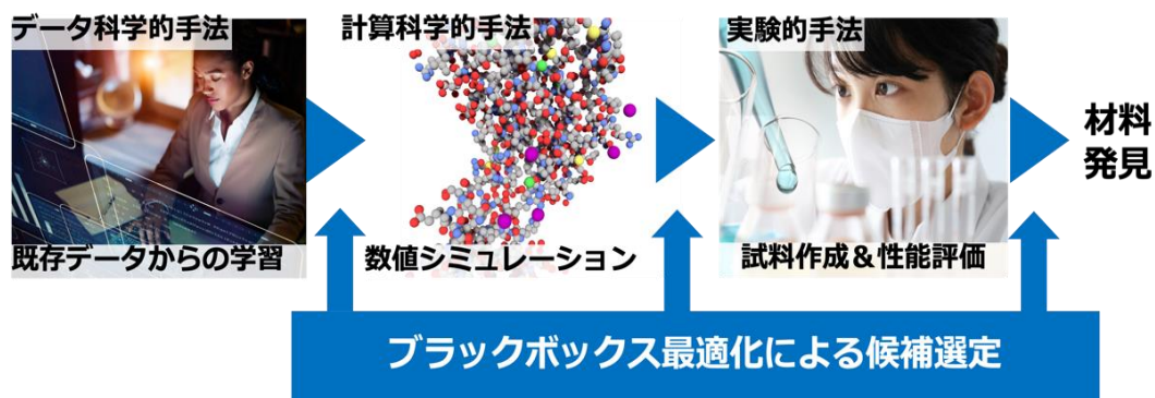
図 2. 製品開発の様々な手法に本最適化技術を組み込むイメージ図