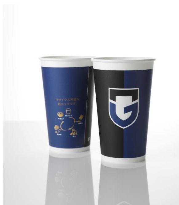
スタジアムで使用される『Gスマイルカップ』

この取り組みは、大阪府が2019年1月に行った「おおさかプラスチックごみゼロ宣言」および同宣言に基づき2021年8月に設置され、吹田市も参画している「おおさかプラスチック対策推進プラットフォーム」における、プラスチックの資源循環を推進する活動の一環として実施されます。