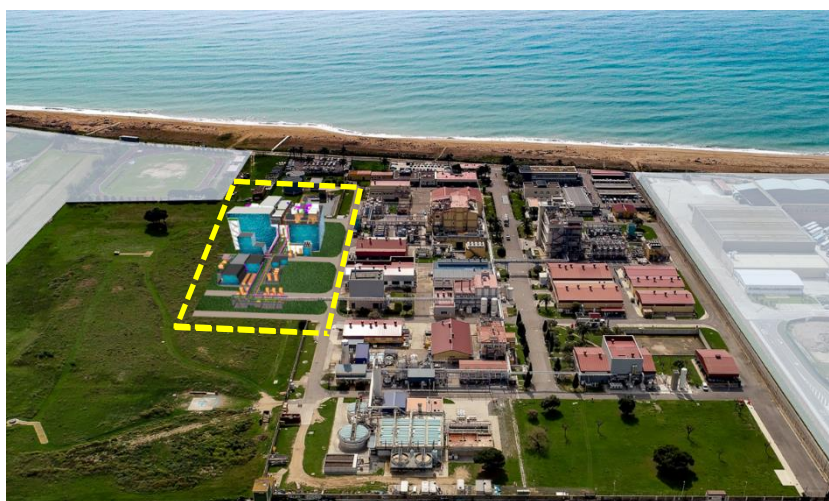
設備増強予定地（黄線部分）

AGC（AGC株式会社、本社：東京、社長：平井良典）は、当社合成医薬品 *1 CDMO *2 事業子会社であるAGC Pharma Chemicals Europe S.L.U.（以下APCE社、本社：スペイン）の設備増強を決定しました。同社敷地内に延床面積 7,500 m 2 の建屋を新設し、現在の生産能力を 30%増強します。稼働開始は 2024 年上期を予定しており、投資総額の見込みは約 120 億円となります。