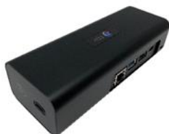
⑤ X線画像診断装置用小型拡張ユニット 「EX-Mobile」