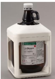
⑲ガロン瓶専用保護ジャケット「ガロテクト ® 」