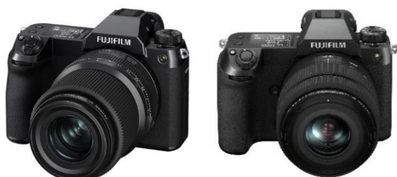
⑨ ミラーレスデジタルカメラ 「FUJIFILM GFX100S/GFX50S II」