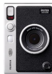
⑧ ハイブリッドインスタントカメラ「チェキ」 「instax mini Evo」