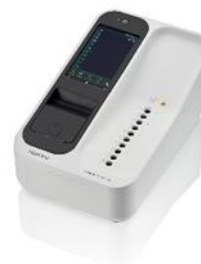
④ 微生物由来成分分析装置「リムセイブ MT-7500」