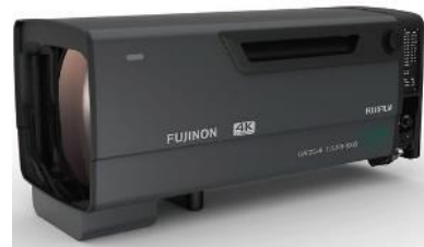
⑯放送用ズームレンズ 「FUJINON UA125x8BESMP-V35F」