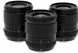
⑫ミラーレスデジタルカメラ「Xシリーズ」用交換レンズ 「フジノンレンズ XF18mmF1.4 R LM WR/ 23mmF1.4 R LM WR/33mmF1.4 R LM WR」