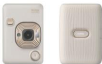
⑦ ハイブリッドインスタントカメラ/スマートフォン用 プリンター「チェキ」「instax mini Liplay/Link」 (ベージュゴールド)