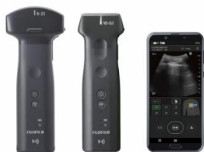
① ワイヤレス超音波画像診断装置「iViz air」 (肺エコーガイド機能搭載)