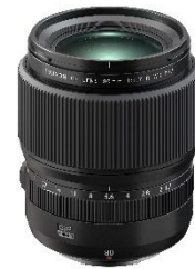
⑭ミラーレスデジタルカメラ「GFXシリーズ」用交換レンズ 「フジノンレンズ GF80mmF1.7 R WR」