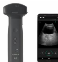
② ワイヤレス超音波画像診断装置「iViz air コンベックス」 (膀胱尿量自動計測機能搭載)