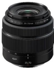
⑮ミラーレスデジタルカメラ「GFXシリーズ」用交換レンズ 「フジノンレンズ GF35-70mmF4.5-5.6 WR」