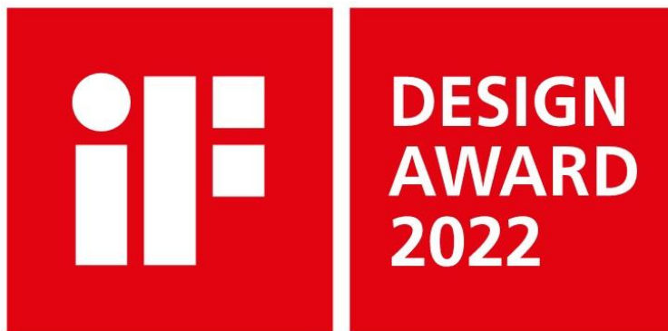
「iF デザイン賞 2022」ロゴ