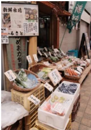
タイトル 新鮮市場 出展者のメッセージ おいしそうやわ～

「懐かしい。が新しい」をコンセプトに、昭和の時代を写した作品やノスタルジックな雰囲気の写真を募集します。