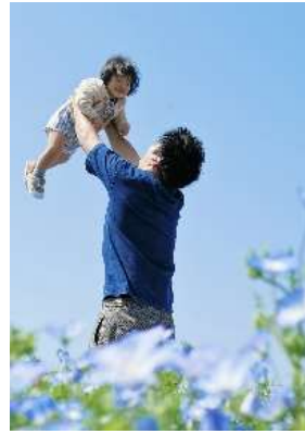
タイトル ママの目に映る幸せ 出展者のメッセージ 春に家族でネモフィラを観に行った時の1枚です。 綺麗なネモフィラと雲一つない青空、そして愛する家族の姿。この一瞬を忘れたくない！と撮りました。