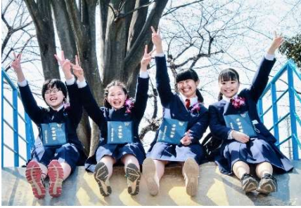
タイトル 未来に翔け 出展者のメッセージ 卒業おめでとう。 仲よし四人組