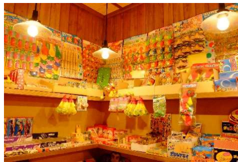
タイトル レトロな駄菓子屋発見！ 出展者のメッセージ 小学生には買えなかった、大好きな駄菓子の箱買いをしました。