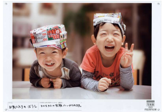
作品に寄せられた絆メッセージ（イメージ）

東京会場・大阪会場では、写真を“カタチ”にすることで、写真に囲まれた楽しい毎日を送ることを提案するコーナーを設けます。富士フィルムの新プロモーション「プリントデイズ by FUJICOLOR」※4と連動し、一部の応募作品を WALL DECOR(ウォールデコ) ※5 やマグカップなどにして展示する予定です。