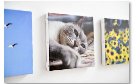
WALL DECOR (172mm×172mm)