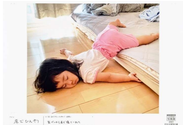
2021年出展作品 タイトル 床でひんやり 出展者のメッセージ 気づいたら床で寝ていました。

富士フイルムは、出展者全員の作品を、“写真に込められた想い”とともに展示する参加型写真展 ※3 を2006年にスタートしました。新型コロナウイルス感染拡大の影響で2年ぶりの開催となった「“PHOTO IS”想いをつなぐ。あなたが主役の写真展 2021」では、来場者より「実際の会場で鑑賞する感動は言葉にならない」「久しぶりに大伸ばしの写真プリントを見た。懐かしくもあり、新鮮だった」などの声が寄せられ、写真には、喜びや感動の大切な瞬間を思い出としてカタチに残し、その想いを共有することでたくさんの人を笑顔や元気にするチカラがあることを多くの方に改めて実感いただきました。