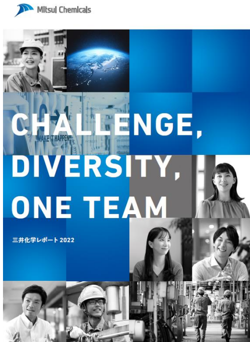
「三井化学レポート 2022 表紙」

*本レポートは、価値報告財団（VRF）の「国際統合報告フレームワーク」、経済産業省の「価値協創ガイダンス」を参照・援用しています。