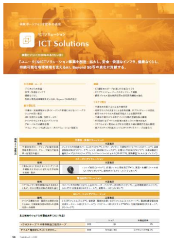
「事業ポートフォリオ変革の追求（ICTソリューション）」

当社はESG推進を機会であり、企業価値の向上につなげること（稼ぐ力の源泉）であると捉え、VISION 2030実現のための5つの基本戦略「事業ポートフォリオ変革の追求」「ソリューション型ビジネスモデルの構築」「サーキュラーエコノミーへの対応強化」「デジタルトランスフォーメーションを通じた企業変革」「経営基盤・事業基盤の変革加速」の説明を通して、財務・非財務一体での当社グループの目標達成に向けた取り組みをご紹介しています。