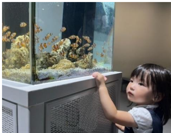
写真2 ポジカを貼った“わざにふれる水槽”の様子