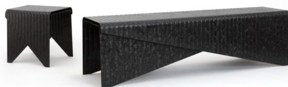
出展のベンチ・スツール