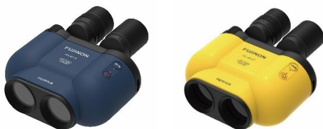
⑱防振双眼鏡 「FUJINON BINOCULAR TECHNOSTABI TS-X 1440」ネイビー・イエロー