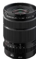
⑯ミラーレスデジタルカメラ「GFXシリーズ」用 交換レンズ 「FUJINON GF20-35mmF4 R WR」