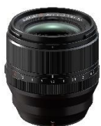
⑮ミラーレスデジタルカメラ「Xシリーズ」用 交換レンズ 「FUJINON XF56mmF1.2 R WR」