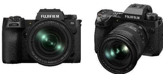
⑦ ミラーレスデジタルカメラ 「FUJIFILM X-H2S / FUJIFILM X-H2」