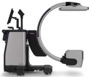
① 軽量 X 線透視診断装置 「FUJIFILM DR CALNEO CROSS」