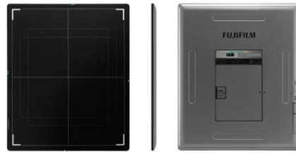
② カセツテサイズデジタル X 線画像診断装置 「FUJIFILM DR CALNEO Flow」