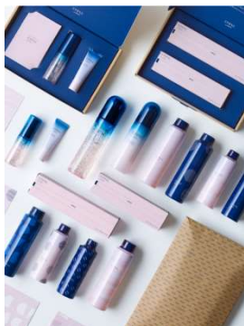
⑤ スキンケアシリーズ 「cresc. by ASTALIFT」