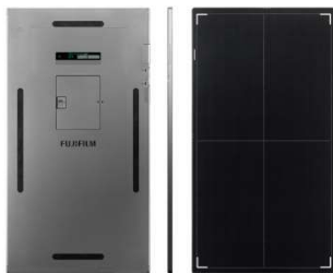
③ デジタル X 線画像診断装置 「FUJIFILM DR CALNEO Flow G80」