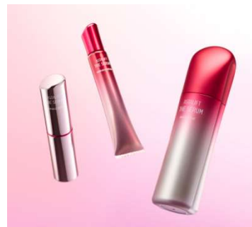
⑥ 高機能美容液シリーズ 「ASTALIFT THE SERUM」