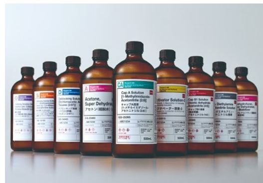
④ 試薬ラベル (体系的なデザインラベルを採用)