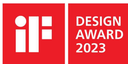
「iF デザイン賞 2023」のロゴ