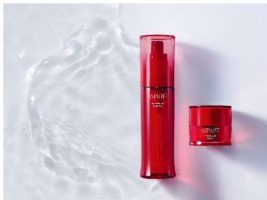
「アスタリフト アドバンスドローション」(左) 「アスタリフト アドバンスドクリーム」(右)

今回、当社は、加齢による肌の厚みの変化に着目した研究をもとに、毎日のスキンケアに使うベーシックアイテムである化粧水とクリームを刷新。新たな美容成分を配合し、年齢を重ねた肌全体にハリとうるおいを与える「アスタリフト アドバンスドローション」「アスタリフト アドバンスドクリーム」を発売します。