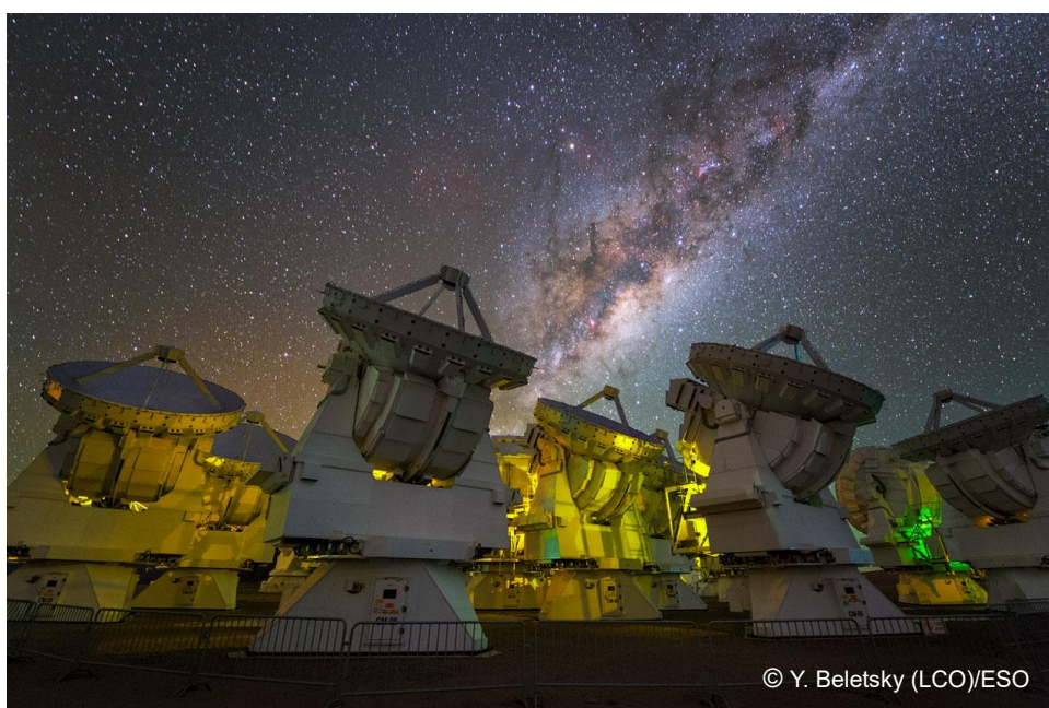
宇宙を望むアルマ望遠鏡