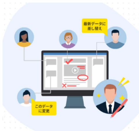
「校正機能」を使用して修正指示を記載しているイメージ図