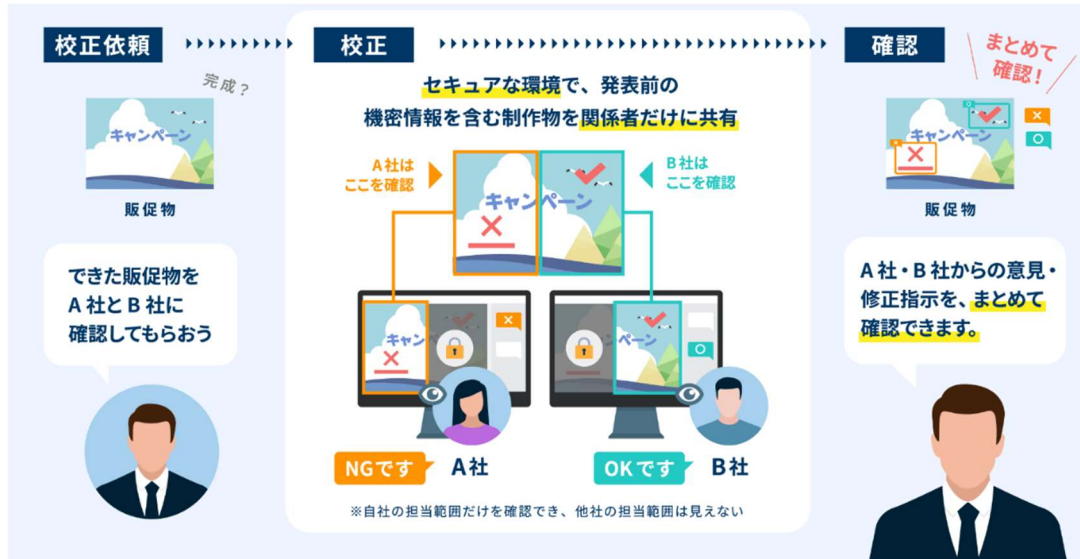
「切り取り機能」で関係者に応じて見える範囲を限定し、「取りまとめ機能」で修正指示を一元的に確認する流れ（イメージ）