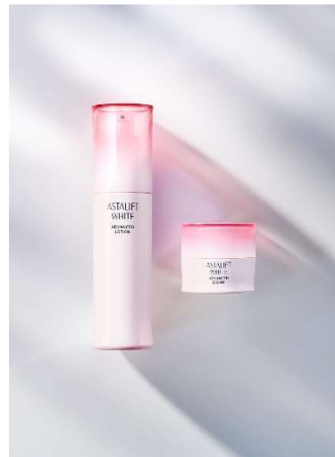
「アスタリフト ホワイト アドバンスドローション」(左) 「アスタリフト ホワイト アドバンスドクリーム」(右)

当社は、くすみ ※1 の発生メカニズムに関する研究を進める中で、複数の要因が互いに影響しあい、くすみ ※1 を悪化させる「くすみ ※1 連鎖」という現象に着目。4種類のブライト ※6 保湿成分を独自の処方では組み合わせることで、「くすみ ※1 連鎖」をケアする複合成分「ナノマルチショット ※4 」を開発しました。今回、同成分を配合した「アスタリフト ホワイト アドバンスドローション」と「アスタリフト ホワイト アドバンスドクリーム」を、「アスタリフト ホワイト」シリーズのベーシックアイテムとして発売します。