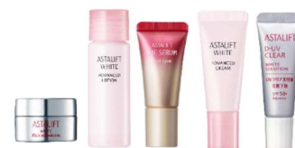
美白/UV お試しセット