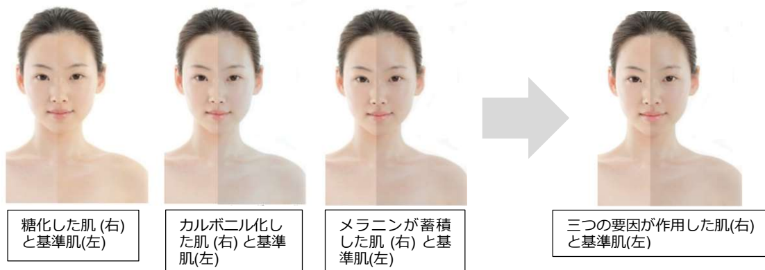
【図2】肌の明るさを低下させる要因による肌色変化をシミュレーションした画像

肌の明るさを低下させる要因(糖化・カルボニル化・メラニン蓄積)によって、基準肌に対して暗い印象に変化することを確認。