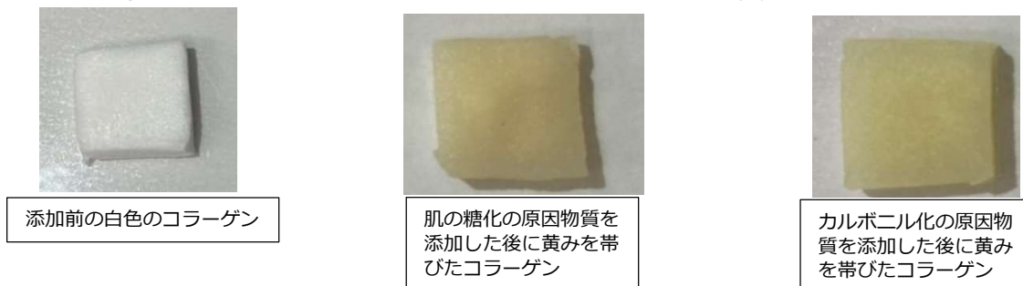
【図1】肌の糖化・カルボニル化の原因物質によるコラーゲンの色変化の検証

コラーゲンに、肌の糖化およびカルボニル化の原因物質を添加し、色の変化を観察した。その結果、肌の糖化とカルボニル化によって、コラーゲンが黄色に変化した。