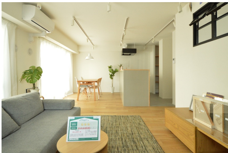
「省エネ性能ラベル」の発行・表示 1号案件「東急ドエル・アルス千住」

「省エネ性能ラベル」の発行・表示 1号案件として、東京都荒川区のリノベーション済みマンションの販売を2024年4月から開始。これは、両社の協業により、省エネ性能を向上させ、BELS 認証「ZEH Oriented」を取得した「ZEH 水準リノベーションマンション」です。省エネ性能ラベルを、不動産ポータルサイトをはじめとした広告媒体に表示するほか、物件内への掲示や、内覧時に消費者への説明も行います。消費者は「エネルギー消費性能」「断熱性能」「目安光熱費」を一目で把握でき、安心して快適な住宅を選択しやすくなります。「省エネ性能ラベル」の発行は、今後両社が協業して ZEH 水準リノベーションを実施する買取再販区分マンションのほか、一棟分譲マンションや一棟賃貸レジデンス、個人向けリノベーション等で対応します。