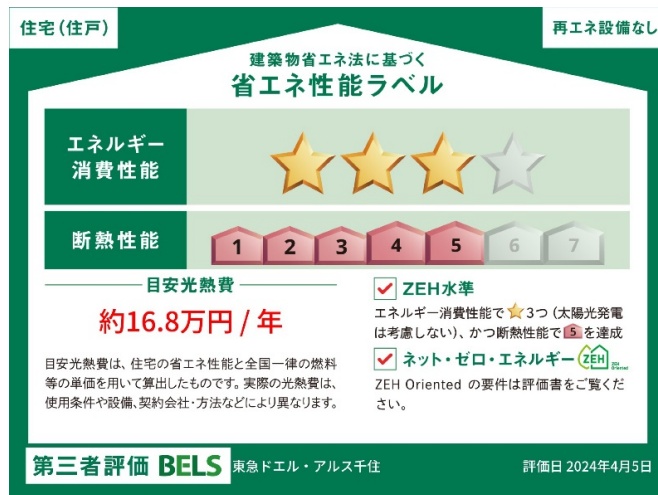
本案件の「省エネ性能ラベル」