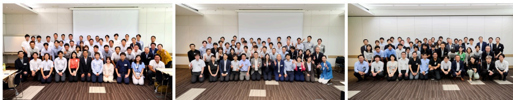
(左から) UNIT-1・2・3の参加者

日本紙パルプ商事は、今後も紙の価値向上に向けて社会に積極的に提案・発信を行うとともに、このような取り組みを通じて、企業価値向上に取り組んでまいります。