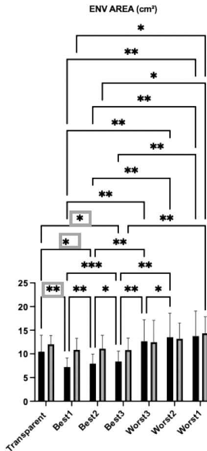
図 1 最適な色上位 3 色(best)と不適な色上位 3 色(worst)のカラーレンズを装着したときの片脚立ち重心動揺試験時の重心動揺面積(ENV AREA cm 2 )の違い (灰色：立位片脚立ち、黒色：前方ジャンプ片脚着地後) .透明レンズ(transparent)装着は比較対照。